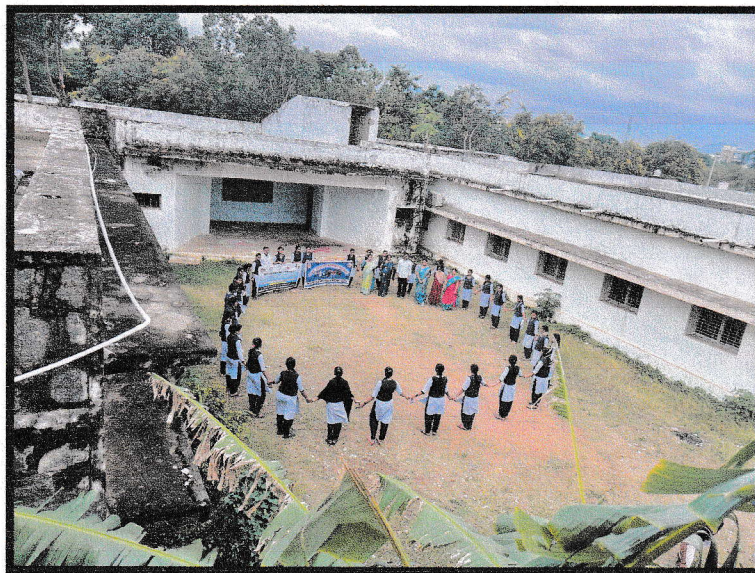
Human Chain Formation